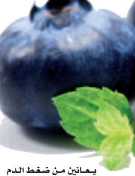
يعانين من ضغط الدم المرتفع.

الصحية يمكن أن تساعد على زيادة كمية خلايا أكسيد النيتريك التي تؤثر على خلايا جدران الأوعية الدموية. وشاركت في الدراسة 48 امرأة تختط كلهن مرحلة انقطاع الطمث، وبلغ متوسط أعمار المشاركات 55 عاماً وكن جميعاً.