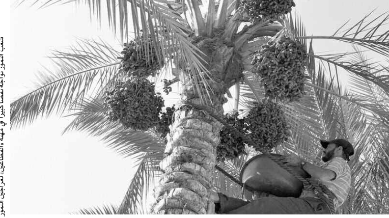
شعب التمور تراجعه تصفيرا كبيرا في منطقة «القنارين» العراجلين النخيل

الشباب واستقطابهم نحو مهنة «القطاع» على مستوى المعهد الوطني للأبحاث الفلاحية «سبيدي مهدي» بولاية ورقلة (160 كلم شمال عاصمة الولاية) والتي يتم من خلالها انتقاء المشاركين ممن يبدون مهارات في تسليق النخيل، غير أن مثل هذه المبادرات تعطي نتائج محدودة.