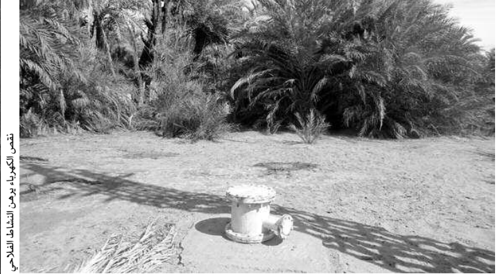
تفحص الكوبلة بوعين الشاف الفلاحي

بأسعار مدعومة لتكون في متناول الجميع، خاصة أن الفلاح في الوقت الحالي يشتريها من السوق الموازية بأسعار مبالغ فيها، حيث أن سعر الكيلوغرام الواحد من الأسمدة يفوق 150 دج. إضافة إلى توفير المبيدات، الخاصة بالوقاية من الحشرات، ورغم أن مندوبية الفلاحة بعين صالح تمنح أدوية، لكن ليس بالقدر الكافي. هذه الوضعية تسبب في ضعف الإنتاج في ظل انتشار الأوبئة التي تصيب النباتات، لكن الانشغال الحقيقي بالنسبة لجميع الفلاحين هو ضرورة الإسراع في إنجاز شبكة الكهرباء الريفية من أجل استغلال الآبار الارتوازية التي بقيت مهملة منذ سنة إنجازها عام 2011، ورغم حاجة الفلاح لمياه السقي، وكان والي تمنراست قد طلب من فلاحين منطقة تديكلت تشكيل جمعية من أجل رفع كامل انشغالهم للتكفل بها، مع التعهد بحل كل المشاكل العالقة.