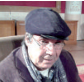
وأفاد الكاتب الجزائريين.