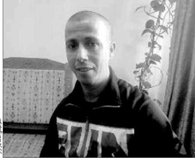
الكوميدي خالد بارازار