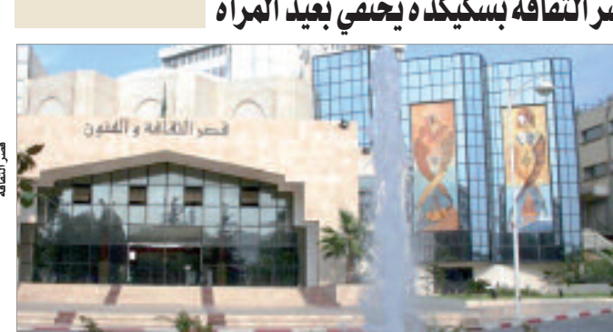
قصر الثقافة والفنون

وسيم تنظيم خلال النصف الثاني من شهر مارس الجاري فعاليات الطبيعة الثانية من أسبوع الضحك لمدينة