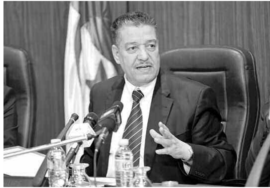
2014 بأبيدس أبيابا.

أكد وزير الصحة والسكان وإصلاح المستشفيات عبد المالك بوضياف أول أمس ببروكسل، أن الجزائر تدعو إلى تضامن فعال ومتعدد الأشكال من أجل القضاء على فيروس إيبولا، مع ضرورة وضع مخطط تقويم لما بعد إيبولا، من أجل الحيولة دون حدوث أي أزمة مماثلة في المستقبل. وأوضح بوضياف، في مداخلة بمناسبة ندوة رفيعة المستوى حول مكافحة فيروس إيبولا المنظمة ببروكسل، أن الأزمة الصحية الناجمة عن الفيروس، يجب أن يكون لها رد عاجل وشامل، داعيا إلى تضامن أكثر فعالية، على أن لا يكون هذا التضامن متعدد الأشكال إلى غاية القضاء على المرض، وإنما كذلك متابعتها من خلال تجسيد مخططات تقويم، لما بعد إيبولا؛ من أجل الحيولة دون حدوث أزمات مماثلة في المستقبل.