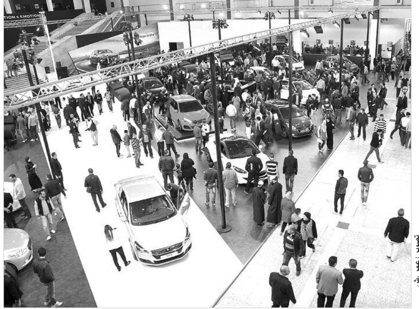
الافتتاحية لصالون السيارات الـ18 بالجزائر

ينبجوت قطع الغيار بل يشترونها بدورهم من مصانع خاصة لصانعتها. وأضاف الوزير أنه لم يمس إرادة من قبل بعض أعضاء الجمعية الجزائرية لوكلاء السيارات مثل "رونو"، "بيجو"، "فولكسفاغن"، و"نيسان" لاحتكام مجال المناولة وصناعة قطع الغيار، مشيرا إلى أن وزارة الصناعة تتفاوض مع هؤلاء الوكلاء ليحت سبل تجسيد هذه المشاريع. وفي هذا السياق، ذكر الوزير بأن الحكومة تمنح تسهيلات وتحفيزات لرجال الأعمال الراغبين في احتكام مجال الصناعات الميكانيكية وخاصة قطع الغيار بتسهيل إجراءات الحصول على العقار الصناعي والتمويل البنكي، كما نص عليه قانون المالية لسنة 2015. ودفتر الشروط المحدد لهذه الوكلاء المعتمدين.