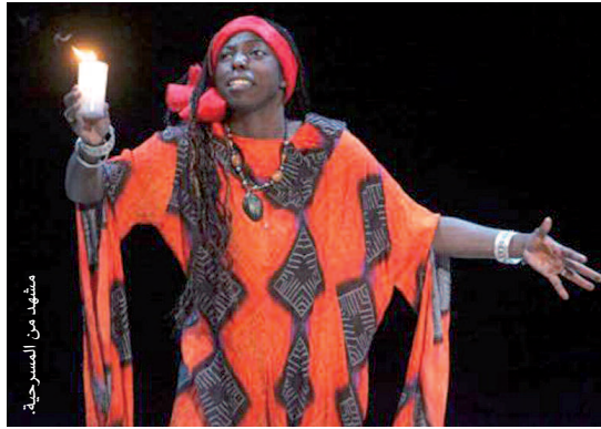
مشهد من المسرحية

بالنسبة للإضاءة، تعمد المخرج أن تكون قائمة توحى بالوحدة ومعاناة المرأة منها، تماشيا مع حركات الممثلة على المسرح، فضلا عن الاستعانة بضوء الشمة الذي كان له دور قوي في تمرير الرسائل التي يتضمنها العمل المسرحي المونودرامي.