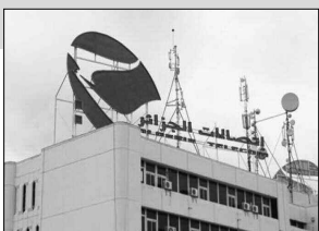
ارتياحهم لهذه العبارة التي قامت بها اتصالات الجزائر التي أكدوا أنها ستك العزلة عنهم.