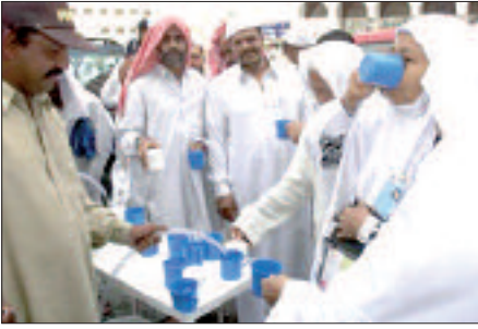
ومتابعة جميع الخدمات المقدّمة في المطاعم والفنادق والمحال في المقدّم للزوار والمعمّرين.