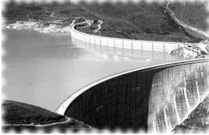
المياه الحلاة أحد الحلول النقص على نيرة مياه الشرب