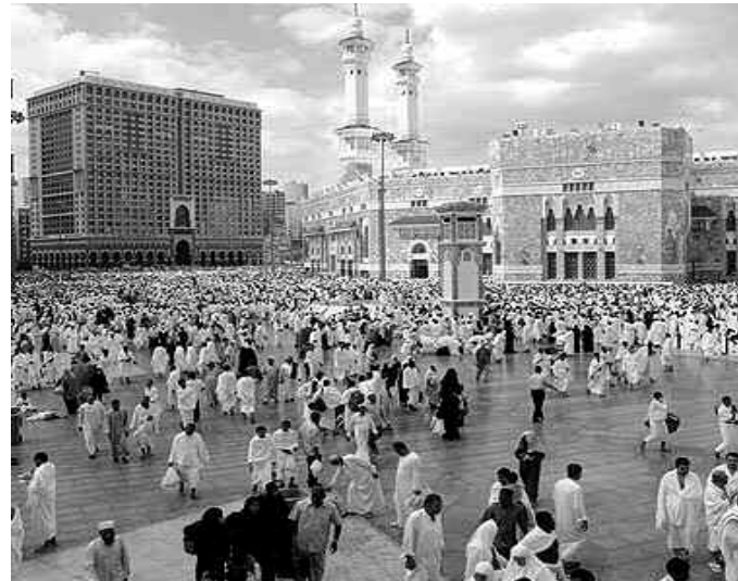
أهل العلم في السعودية.

بثلاثة أجزاء من القرآن الكريم يومياً، وتستمر تلك الصلاة حتى حدود الساعة الثالثة صباحاً، وبعد يوم السابح والعشرين من رمضان، يبدأ الأهالي بتوزيع زكاة الفطر وصدقاتهم على الفقراء والمساكين وابن السبيل، ويستمرّون في ذلك حتى قبيل صلاة العيد. وانتشرت في السعودية - وبكثرة - عادة طبية، وهي إقامة مواسم إفطار خاصة بالجاليلات الإسلامية والعمالة الأجنبية المقيمة في السعودية، وتنام تلك المواسم بالقرب من المساجد، أو في الأماكن التي يكثر فيها تواجد تلك العمالة، كالمناطق الصناعية ونحوها، ومن العادات المباركة في السعودية أيضاً توزيع وجبات الإفطار الخفيفة عند إشارات المرور للذين أدركهم أذان المغرب، وهم بعدُ في الطريق إلى بيوتهم؛ عملاً بسُنّة التعجيل بالإفطار.