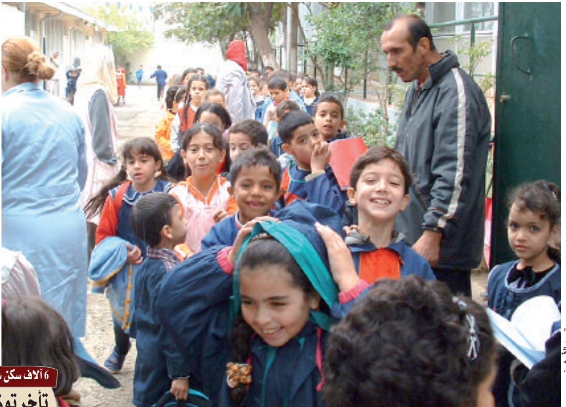
صورة من الأرشيف

كشف وزير التربية الوطنية السيد أبو بكر بن بوزيد أن عدد المناصب المالية المفتوحة في قطاع التربية لسنة 2012-2013 يقارب 30 ألف منصب بيداغوجي وإداري. مشيراً إلى أنه من بين 28.579 منصبا ماليا في القطاع يوجد 16.521 منصبا خاصا بالتر بويين للحصول على منصب أستاذ التعليم الثانوي والمتوسط والابتدائي.