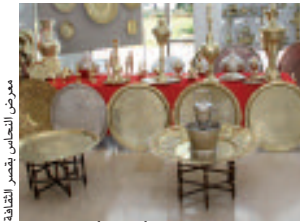
معرض النحاس بقصر الثقافة

ويأتي تنظيم المعرض الذي حمل هذه السنة شعار «فن صناعة النحاس الجزائرية» ليبرز ما تزر به الجزائر من موروث عريق في مجال صناعة النحاس التي بناهز عمرها 5 آلاف سنة، استمدت شهرتها من الإزدهار العثماني.