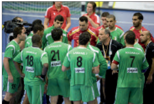
هذه الفترة الصيفية،

وهكرنا في الالتحاق بصريا عبر تونس، لكن دون جدوى. ويتأسف السيد كرد الواد. ويعتبر هذا الترتيب