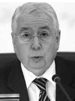
قادة اثيوبيات العظماء وأخبرهم الإمبراطور هيل

جدد رئيس مجلس الأمة، السيد عبد القادر بن صالح، أمس الأحد، باديس آبايا تعازي رئيس الجمهورية السيد عبد العزيز بوتفليقة للسلطات الاثيوبية على اثر وفاة الوزير الأول لجمهورية اثيوبيا الاتحادية ميلاس زيناوي حسب مصدر دبلوماسي.