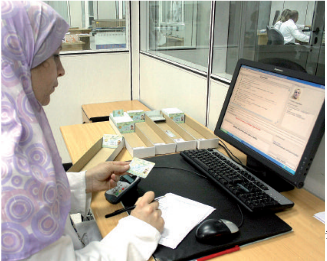
صورة من الأرشيف