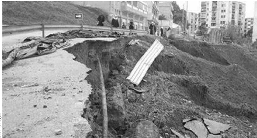
صورة من الموقع

بأعمال ملموسة تهدف إلى تحسين معرفة المخاطر وتعزيز مراقبتها والوقاية منها، مع تطوير المعلومة الوقائية حول هذه الأخطار وكيفية التكفل الفعلي والمتكامل بكل خطر طبيعي الذي ينظم المسمى العمومي، وإشكالية التغير المناخي والأخطار الطبيعية في الوسط الحضري ذات أهمية، خاصة بالنسبة لمدين الساحل في الجزائر.