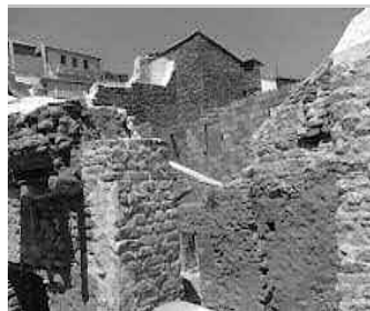
مليين دينار، في حين بلغت كلفة عمليات الترميم 100 مليون دج، إضافة إلى تخصيص ميزانية إضافية لإنجاز الترميمات والإصلاحات الفنية الدقيقة داخل المدينة. وحددت معالم حدود منطقة القصبة المتبقية المحفوظة لهذه المدينة وفق القانون الصادر في شهر سبتمبر من سنة 2007، من الجهة الشرقية بوادي تيزا ومن الجهة الغربية بمقر الدرك الوطني وبمينا دلس من الجهة الشمالية وغاية بوغربي جنوباً.