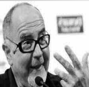
تسوّفي المخرج السينمائي الإسباني المعروف بخوان خوسي بيغاس لونا، بعد صراع مع السرطان عن 67 عاماً. وبيغاس لونا معروف في إسبانيا

بأفلامه التي تتضمن مشاهد مثيرة مثل «بيلباو» في 1978، وحقق أيضاً نجاحاً تخطى حدود بلده في السنوات الأخيرة بفيلمه «اسمي خوان» في 2006 والذي يتناول قصة امرأة شابة هجرت ببلدتها الصغيرة إلى أصدقاء العاصمة الإسبانية مدريد، وقالت أكاديمية فنون وعلوم السينما الإسبانية في بيان، أن بيغاس لونا الذي كان يعمل في إخراج فيلمه القادم توفي في منزله بباراغونا قرب برشلونة شمال شرق إسبانيا.