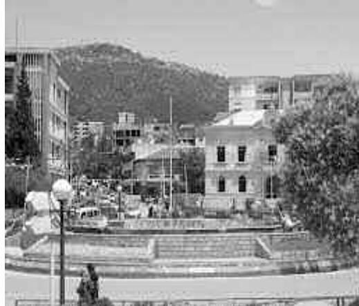
إنجاز مكتبة للقرأة العمومية على مستوى المقر القديم لسوق الجملة لتيزي وزو بغلاف مالي قدره 70 مليار سنتيم، مع الإشارة إلى أنه تم تخصيص 25 مليار سنتيم لترميم قاعة سينما «جرجرة».

كما تضم المشاريع الـ 43 التي استفاد منها القطاع بالولاية، عملية اقتناء عتاد لفائدة 63 مكتبة بلدية خصص لها مبلغ مالي قدره 63 مليار سنتيم، وكذا أشغال