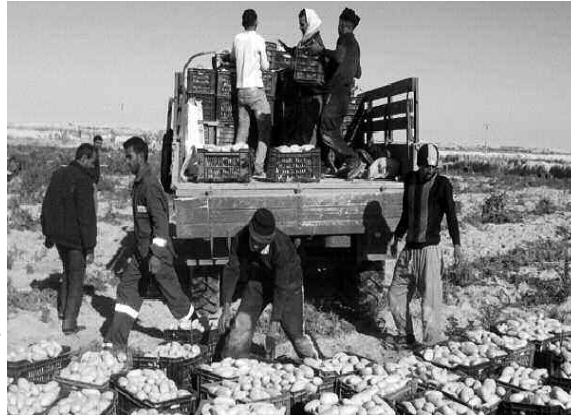
صورة من الأشغال

التنمية الخاصة بالكهرباء والمسالك الفلاحية، وكذا استعراض وضعية التطهير الفلاحي، كما أكد والي الولاية في هذا الإطار على ضرورة إشراك ممثلين عن الفلاحين ومحافظة الغابات ومصالح أملاك الدولة ومسح الأراضي، لمتابعة مختلف المشاكل المتعلقة بتحديد المناطق الرعوية والمناطق الفلاحية، على أن تتم متابعة سير العملية باستمرار إلى غاية الانتهاء من هذا الملف الذي يوزق الفلاحين ومربي المواشي على حد سواء.