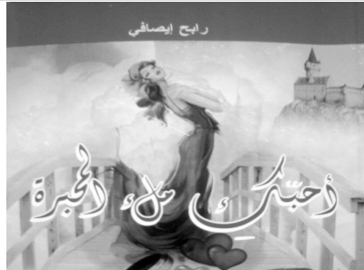
وراجي المرجي، أن ما يميز الشاعر راجب إيصافي بنبأوه الخاص للصورة الشعرية، مثل «خارج مجال التغطية»، «المعجزة»، و«فيضانات باب الوادي»، وجاء في تقديم الشاعر

صدر مؤخرًا للشاعر راجب إيصافي في أول تجربة له مع النشر، ديوانان هما «مواعيد الصدف» الذي يضم 13 قصيدة، و«أحبك ملء البحيرة» بـ 75 قصيدة، عن دار القدس العربي للنشر والتوزيع. ويقع ديوان «مواعيد الصدف» في 68 صفحة، ويحتوي على مجموعة من القصائد ذات النماين المتناظرة، تمتع على غرار «ما أزهه للأمنيات»، الممكن يصير واجبا، «أرض الله»، «إني أحسبك مني»، وأسئلة الموت فرج الأوبة، كما لا تختلف جمالية الصورة الشعرية في ديوانه الثاني «أحبك ملء البحيرة» الذي يقع في 78 صفحة ويضم 75 قصيدة، من بينها «فضول الظل»، «النسيجه»، «آخر الكلام»، «هدايا الحياة».