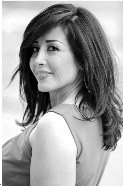
وتتعلق بإطلاق الأكاديمية اللبنانية للسينما التي أطلقت عليها اسم «وسامة» للإنتاج الفني، تعمل على تدريب الكوادر الفنية التي تريد

عرف المسلسل نجاحا واسعا ودوري فيه من أهم الأدوار التي اعتز بها، واعتبرت أن المخرجين حاصرون في أدوار الأم لأنني ظهرت في الكثير من المسلسلات بدور «الأم» وفي كل حالاتها الانفعالية والاجتماعية وأقنعت الجمهور، لكنني سأعمل مستقبلا على الخروج من هذا الدور، وسأطلل عليه في شهر رمضان المقبل في دور جديد ومختلف في مسلسل «24 قيراطا» الذي اعتبره إضافة لي، العمل ككتبة ريم حنا وأخرجته سعيدة الماروق، وقد أعجبني النص، وأحببت دوري لأنه مكتوب بشكل رائع، وطبعاً ساهم في موافقتي على المشاركة في العمل، بالإضافة إلى النجوم الذين يشاركون فيه وكل فريق العمل.