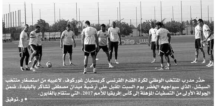
حذر مدرب المنتخب الوطني لكرة القدم الفرنسي كريستيان غوركوف، لاعبيه من استصغار منتخب السيشل، الذي سيواجهه الأخضر يوم السبت المقبل على أرضية ميدان مصطفى تاشكار بالبيدية، ضمن الجولة الأولى من التصفيات المؤهلة إلى كأس إفريقيا للأمم 2017، التي ستقام بالغابون. * وتوفيق