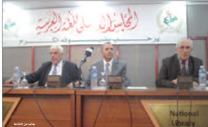
جانب من النشاط