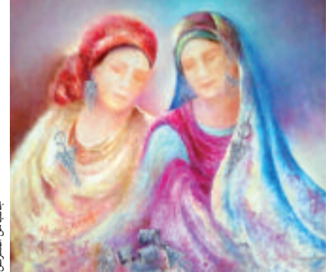
أعمال فنانة قسنطينية