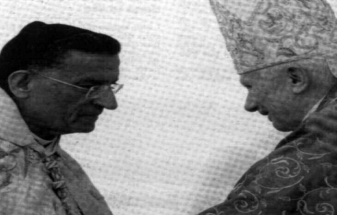
بنا القديان فقط من تلاميذ السيد الإسلامي في أوروبا

تراجع في السنوات الأخيرة عدد المترددين على الكنيسة من طرف الشعب الفرنسي بشكل ملحوظ، الشيء الذي أقلق رجال الدين المسيحيين ورجال الكنيسة، وأصبحت بعض الكنائس خاوية على عروشها، ما جعل بعض رجال الدين يتبرعون بها للمسلمين لتحويل إلى مساجد، فقد قدم لنا الكاتب الفرنسي ليوجي نموذجاً بين فيه الشباب الفرنسي قاطع الكنائس بشكل أثار قلق رجال الدين، ويقول الكاتب في دراسته هذه، بأن نسبة 23% من المسلمين يترددون على المساجد على الأقل مرة في الشهر، مقابل 5% فقط بالنسبة