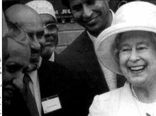
ملكة بريطانيا في إطار من شخصيات إسلامية

زار الأمير البريطاني مركز «أوكسفورد» للدراسات الإسلامية، ألقى فيه خلالها خطاباً تحدث عن العلاقات بين الغرب والإسلام قائلاً: «أعتقد من صميم قوايدي أن العلاقات بين الغرب والإسلام أكثر أهمية من أي وقت مضى، حقاً إن سوء التفاهم لا يزال خطيراً بين العالمين الإسلامي والغربي، وأعتقد أن الحاجة تدعونا إلى العمل والتعايش سوياً في هذا العالم المضطرب، إن ما يجمع الغرب والإسلام أكثر مما يفترقه، فالمسلمون والمسيحيون واليهود كلهم ينتمون إلى الكتاب المقدس، وإننا في الغرب عندما نذكر سنة 1492، نتذكر بالتالي اكتشاف أمريكا من طرف كولومبوس، لكن هذا التاريخ عند المسلمين يذكرونه بعام 1492، وهو العام الذي سقطت فيه غرناطة بين أيدي فيرناندو الملكة إيزابيل، وإننا في بلادنا ننظرون إلى الشريعة الإسلامية كشريعة قاسية وهمجية وهو ما يغذي الإعلام، لكن الحقيقة ليست كذلك، ومع الأسف سوء التفاهم بين الغرب والإسلام لا يزال قائماً رغم تطور التكنولوجيا والمعلوماتية، وأرى أن الجهل بالإسلام وراء كل هذا، فليتنا أن نعلم أن هناك ملايين المسلمين يعيشون في الكومنولث البريطاني، وأكثر من 10 ملايين مسلم يعيشون في أوروبا...، وكلام كثير للأمير البريطاني يتضمن حقائق ووقائع تضد أطروحات المتطرفين.