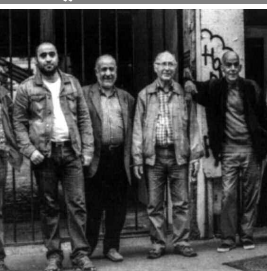
مجموعة من مهاجري الجزائر بفرنسا مهدون بالطر من سكانهم

الشيخوخة في الغربية، بعيداً عن الأهل والوطن، وحثت أكثر من شخصية على ضرورة الاهتمام بهذه الشريحة التي قدمت شبابها وصحتها في سبيل رقي البلاد ورفع شأنها وساهمت في العمران، وإعادة ما خربته الحرب العالمية الثانية، ولهؤلاء حق على فرنسا، وواجب عليها رعايتهم، خاصة أنهم في نهاية العمر، بعد معاناة الغربية والعنصرية وقساوة الحياة، وهل هذا كله لا يكفي؟ وهل جزاؤهم القإاؤه في الشارع، وقد قضاوا حياتهم خدمة لهذا البلد؟.