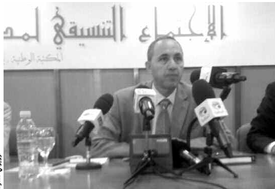
الوزير في الاجتماع

اجتمع عز الدين ميهوبي، وزير الثقافة أمس، بالكتابة الوطنية بالحامة، مع مديري ومسؤولي القطاع على مستوى الولايات قصد تقديم التوجيهات اللازمة، وكذا الاستماع إلى انشغالات واقتراحات الحاضرين من 48 ولاية.