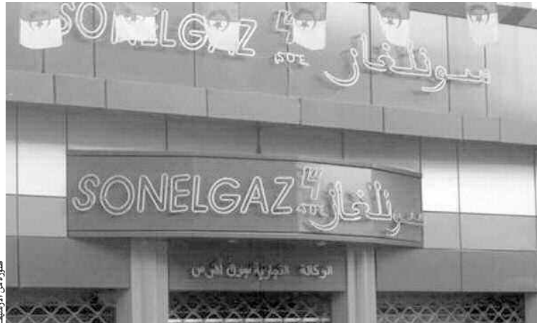
المدير العام لشركة توزيع الكهرباء والغاز للشرق