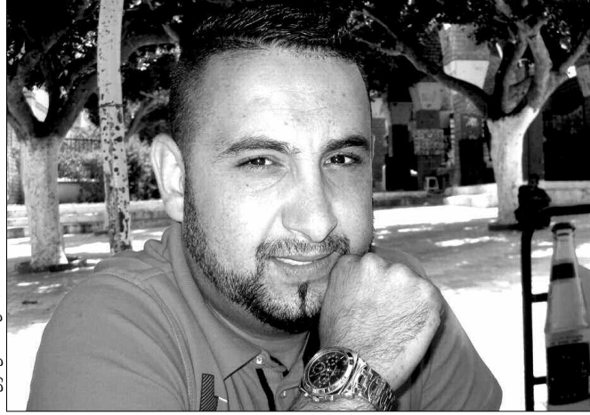
الفنان مصطفى مولى