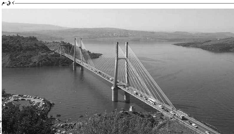
سد بني هارون

دعا منتخبون بالجلس الشعبي لولاية ميلة، إلى «تفعيل» كل الوسائل القانونية لحماية سد بني هارون، الواقع بإقليم هذه الولاية، من شتى التجاوزات التي تطال حوضه الأمني منذ عدة سنوات، منها استمرار الحرق غير الشرعي لأراض تقع ضمن الحوض الأمني لهذه المنشأة.