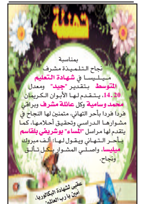
عقب شهادة البكالوريا، ابن يارب المعلن.

من مجلة الأخطار التي وقفت عليها "المساء" وتهدد حياة الأطفال على مستوى ساحتي الحرية وأول نوفمبر بوسط المدينة، الفوضى العارمة التي أضحت تميزها من خلال هروما من قبل بعض الشباب الذين يقومون بكرة الدراجات النارية من مختلف الأحجام، للأطفال الصغار،