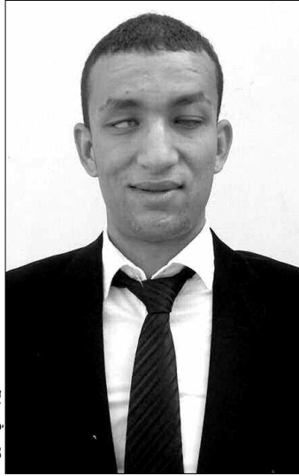
المنشد غريب تقي الدين