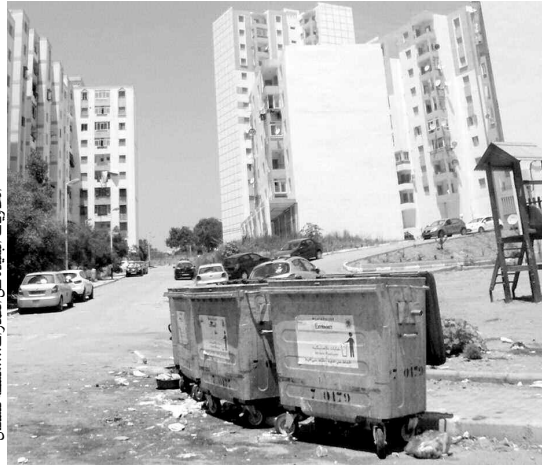
الحيات المقيمة عن الممارات... مشقة للسكان

زائر حي "عدل 2" بهراوة، ورغم الطراز المعماري المتناسق، تستوقفه العديد من النقاط السوداء التي صارت بالنسبة للسكان هاجسا، ومصدرا للتساؤل، ومن بينها كما لاحظنا في الميدان، مشكل تسير النفايات ورفعها من طرف أعوان مؤسسة "إكسترنات"، وقد لاحظنا أكياس القمامة مرمية بطريقة عشوائية بالعديد من النقاط وزوايا العمارات، وكذا داخل المحلات الشاغرة، مشكل المحلات التي تبقى 99 بالمائة منها مغلقة وبعضها مخربة وصارت - حسب السكان - مكانا للزبالة ولم يعد عدد المحلات المستغلة ثلاثة.