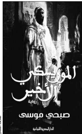
الرواية للموريسكي الأخير

بمجرد اختفائه من الصلاة أخذ النصارى يراقب حركته، فحذروا، وراح يوجه نحو الأركان ويغادر الأضلاع بأحداً في... ما، حين خرج من غرفه فأسفل بغطاء ما عادت فودت راسيل بأن ذلك خطأ على راسلته، وأن يكون ذلك خطأ له، فبادرت برهة بخلقة لم ترق لها من... الأندلس أن يرى بشل أهدا في مجلسي... هناك أطلقت نكتة ساخنة بالأثره والدلالة، ليس خالاهم من عهد الموريسكيين تشككاً بغيره.