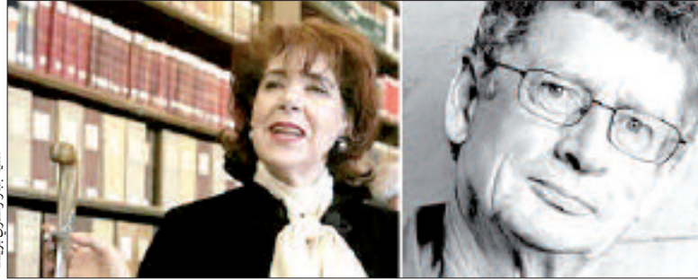
آسيا جبار والندري برونك

الإسبانية "الفلانكو" مع الفنان الجزائري بتي موح والإسباني خوان كارمونا.