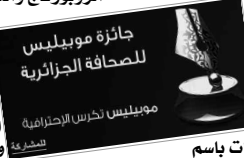
جائزة موبيليس للصحافة الجزائرية

أعلن متعامل الهاتف النقال "موبيليس"، عن تمديد آجال إبداع الملفات المشاركة في جائزة موبيليس للصحافة الجزائرية، التي كانت مقررة في الفاتح أكتوبر إلى غاية 10 من نفس الشهر على الساعة الرابعة والنصف مساء. وقال بيان لموبيليس، إن هذا القرار اتخذ من أجل السماح للصحفيين الذين لم يتمكنوا من إيداع الأعمال الصحفية لاستكمال مشاركتهم، حيث تودع الملفات باسم رئيس لجنة موبيليس للصحافة الجزائرية. للتذكير، فإن المسابقة تخص كل عمل صحفي نشر في الصحافة المكتوبة أو الإلكترونية أو أذيع أو بث في الحصة