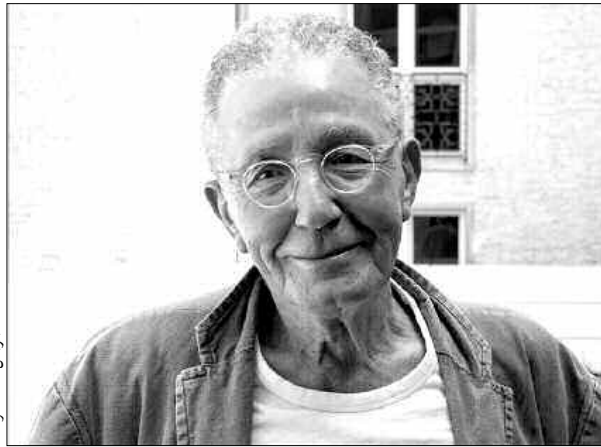
الراحل مالك علولة

الملاحظ في القصيدة الأولى، مثل "التجدر" التلويحي الذي يبرر الذاكرة والتاريخ. أما الجزء الأخير، فيتألف من قصيدة واحدة بعنوان "أمطار المعجزة"، تشكل في طبيعتها مزيجاً من الجزأين السابقين، إذ نغثر فيها على ذلك الشكل اللاهث وأيضاً على ذلك الشعر الرؤيوي الذي يلتمح فيه الإنسان بالحس والعلامة: "وما نحن قد أصبحنا السماء وفجرها/ أصبحنا أنوار هذا الفجر والوانه/ أصبحنا هذا البلور اللامتناهي/ وأيضاً هذا التحول (...)" قصيدة يعبر علولة فيها بلا مواربة عن إيمانه بقيامته، بعد الموت، قيامته تظلل مجمل ديوانه وتشكل كلمته الأخيرة: "نحن، كمكائن مستنقن