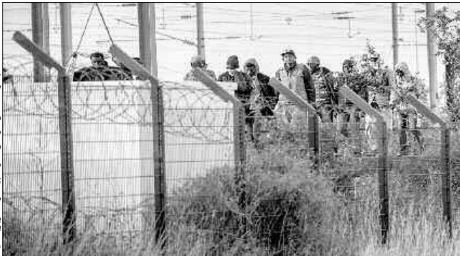
بحر "المانش" - أنفق الموت بين فرنسا وبريطانيا

بلدية "كالي" قائلا: "علاما أن البريطانيين لم يتحملوا مسؤولياتهم في الموضوع، فلن يكون هناك حل". في حين تسمح تصريحات برنار كازناف، وزير الداخلية الفرنسي وزميلته البريطانية تريزا ماي، فتفتقن على أن الحل سيكون في صالح البلدين ومن طرف دولتين. ومن جهة أخرى، أكد كل من برنار كازناف وتريزا ماي بأنه على أوروبا أن تتعاون معنا في هذا الموضوع.