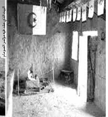
البيت الذي عقد فيه مؤتمر الصومام