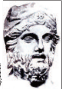
معرض التراث الموسيقي

تفاعل الجمهور القسنطيني الخميس الفارط مع الأحداث التاريخية لمسرحية "لقاء في سيرا"، التي تم عرضها على مدار ساعة وربع ساعة من الزمن بركب المسرح الجهوي في إطار فعاليات قسنطينة عاصمة الثقافة العربية 2015.