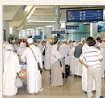
لولايات الوسط، أن التنظيم الجديد "يجري بالتنسيق بين

المقدسة لفائدة الحجاج الميامين لموسم 2015