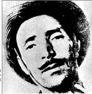
معرض التراث الموسيقي