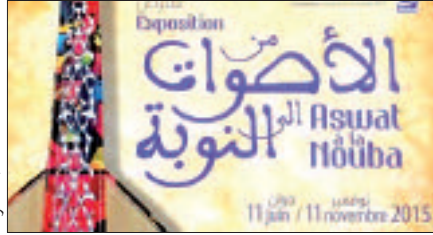
معرض التراث الموسيقي