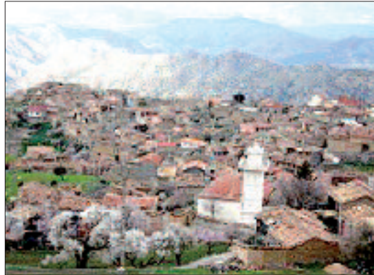
جانب عدة قرى مجاورة. صخرية على ارتفاع يتراوح بين (1050 و 1297 متر) على مستوى سطح البحر، تحيط بها وديان شديدة العمق ودائمة الجريان، إلى

ومن شأن المرسومين التنفيذييين أن يحافظا على هذين المعلمين الأثريين، وأن القرار يترجم سعي الدولة لحماية الموروث القاري من خطر الزوال والتخريب وما قد تسببه العوامل الطبيعية، ومن شأن هذه الحماية أن تدفع الوصاية لتدرك النفاذ وجعل القطاعين قطبين مهمين للسياحة الأثرية.