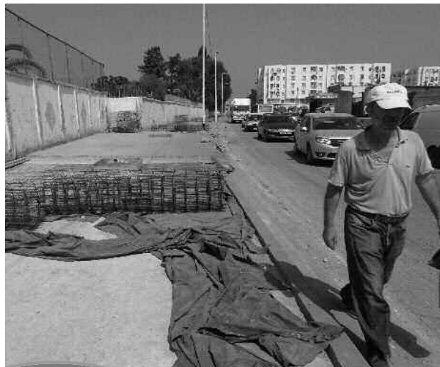
الاصف المتصلي: الساعات ايضا