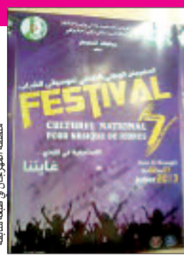
آية الله في العالمين