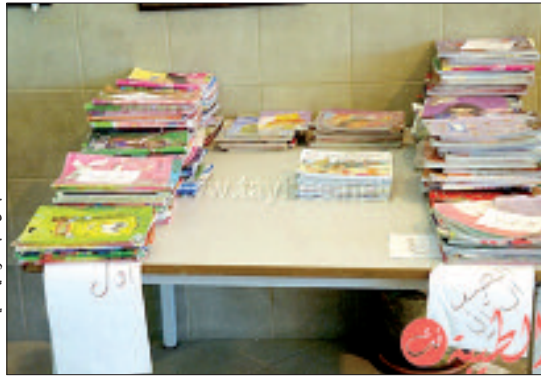
تبادل كتب مدرسية قديمة