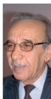
المشاور الفني للفقيد.

ووروي محمد الأغنية الشعبية بوجمعة العنقيس، الذي وافته المنية مساء أمس الأربعاء، عن عمر يناهز 88 سنة، التي بعد ظهر الخميس، بمقبرة القطار بالجزائر العاصمة بحضور حشد كبير من محبيه. ودفن صاحب الأغنية الشهيرة "راح الفاني راح" في جو مثيرة الشغف والحزن والتأثر لدى العديد من المواطنين جاؤوا لحضور الجنازة وتقديم التعازي لأولاد الفقيد الثلاثة. كما حضر الجنازة بعض منى الشعبي منهم كمال فرح الله، تلميذ الحاج محمد العنقي وجليل قبائلي ابن محمد إبراهيمي (المدعو الشيخ قبائلي) الذي ساهم كثيرا في إطلاق