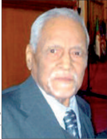
أبو القاسم سعد الله

الطبعة السابعة للمهرجان والتي تنظم بالمسرح الوطني الجزائري في الفترة الممتدة من 12 إلى 19 سبتمبر الجاري، وهذا بعد غد بقر المهد الوطني العالي للموسيقى ابتداء من الساعة 11 صباحا.