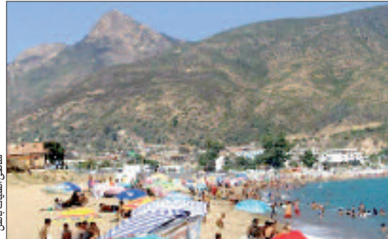
شاطئ بيجيني عند مدخل مسطوره