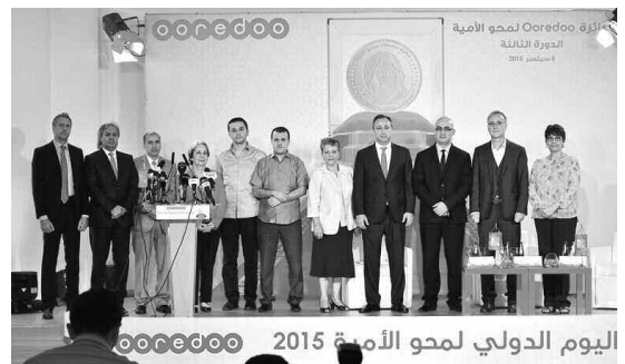
اليوم الدولي لمحو الأمية 2015