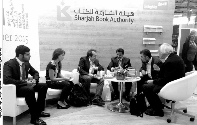
جانب من المحادثات التي أجراها وفد الهيئة للكتاب مع المشاركين في معرض موسكو الدولي للكتاب

ويعد معرض موسكو الدولي للكتاب من أهم معارض الكتب في شمال ووسط آسيا، وشرق أوروبا، وبشكل بوابة عبور نحو الناشرين المقيمين في هذه المنطقة الجغرافية الواسعة، التي تعتبر في نفس الوقت صاحبة تاريخ عريق وطويل من الاهتمام بالكتاب، والعناية بنشره، وتمتلك الكثير من خطوط التواصل مع المعلنين العرب والإسلامي على مدى عقود طويلة من علاقات الصداقة والتعاون. وشهد جناح هيئة الشارقة للكتاب في معرض موسكو، زيارة سعادة إسماعيل الزعابي، المفصل بسفارة الدولة في موسكو، الذي أعرب عن فخره واعتزازه بهذه المشاركة، وتسلم من سعادة أحمد بن ركاض العامري، رئيس هيئة الشارقة للكتاب، النسخة العربية من كتاب "حديث الذاكرة" لمؤلفه صاحب السمو الشيخ الدكتور سلطان بن محمد القاسمي، عضو المجلس الأعلى حاكم الشارقة، كما شهد الجناح زيارات أخرى لعدد من الشخصيات الرفيعة في روسيا، ومن بينهم: البير اسكن، الملحق الثقافي التركي في موسكو، وسيرجي ميدفيديكي، مدير الوكالة الاتحادية للصحافة، وديميتري إيتزوفيتش، نائب رئيس وكالة. وقال سعادة أحمد بن ركاض العامري، رئيس هيئة الشارقة للكتاب: "جاءت مشاركتنا في معرض موسكو الدولي للكتاب، من منطلق إيماننا الثابت بضرورة تعزيز الحوار بين الثقافات، وزيادة التواصل بين مختلف المهتمين بصناعة الكتاب، في إطار رؤية صاحب السمو الشيخ الدكتور سلطان بن محمد القاسمي، عضو المجلس الأعلى حاكم الشارقة، الذي أراد للشارقة أن تكون محطة إشعاع حضاري وتواصل فكري بين مختلف الشعوب".