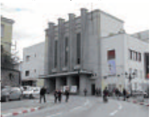
المسرح الجهوي لبلدية

سيتم العرض الشفري لمسرحية بعنوان "الخليفة" من إنتاج المسرح الجهوي عبد الملك بوقرموح لبلدية، يوم الخميس المقبل بقسنطينة، حسبما أفادت به ندوة صحفية نظمتها بقر المسرح الجهوي لقسنطينة بأن هذه المسرحية المترجمة إلى العربية الدارجة من طرف نخبة تونري هي عبارة عن "تراجيديا كوميدية تحكي التاريخ عبر الزمن حيث يمتزج الواقع بالخيال". وتحتوي مسرحية "الخليفة" قصة حيلة ملك يشع خيرا مفاده أنه يبحث عن خليفة له ليتفقد الوجه الحقيقي للناس وذلك في عرض يعيد فيه المسرح "فضاء الحرية" حسبما ذكرته المخرجة. وفي إطار ورشاشي مضحك وتراجيدي، تظهر هذه المسرحية أوجه مختلفة للطبيعة البشرية والأناثية والفن والخيالة لكن أيضا السخاء والبساطة والساذجة وذلك خلال 70 دقيقة من مدة هذا العرض.