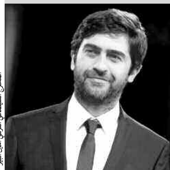
المخرج السينمائي التركي أمين ألبير

تبادل الإنتاجات المعرفية بينهم، واعتبر أن حرص إدارة معرض موسكو الدولي للكتاب على ضرورة مشاركة الهيئة في فعاليات، يؤكد على الشهرة الواسعة التي يحظى بها معرض الشارقة الدولي للكتاب في مختلف قارات العالم. والتقى سعادة أحمد العامري بسعادة سيرجي كاكيين، مدير معرض موسكو للكتاب، وتناولا سبل تطوير العلاقات والتبادل الثقافي بين هيئة الشارقة للكتاب والمديرية العامة لمعارض الكتاب الدولية بروسيا، وسبل تعزيز أواصر التعاون بينهما مستقبلا فيما يخص قضايا النشر، وثقن كاكيين دور معرض الشارقة الدولي للكتاب في نشر الوعي والمعرفة، وتعزيز ثقافة الحوار بين مختلف شعوب العالم، وتقدم بالشكر إلى هيئة الشارقة للكتاب لمشاركتها في فعاليات المعرض التي تدل على حرص واهتمام دولة الإمارات بشكل عام وإمارة الشارقة بشكل خاص بالثقافة ونشر الكلمة المقروءة، وأكد على أن مشاركة دور النشر الروسية في الدورة الـ 34 لمعرض الشارقة الدولية التي ستطلق في نوفمبر القادم، لن تقل بأي حال من الأحوال عن مشاركة العام الماضي، كما أن الدورة الـ 35 مستهدفة مشاركة 230 دار نشر روسية. وأجرى وفد الهيئة المشارك سلسلة من اللقاءات والاجتماعات مع عدد من دور النشر والمختصين، في الجناح الخاص بالمعرض الذي شهد حركة نشطة