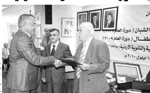
جائزة عبد الحميد شومان