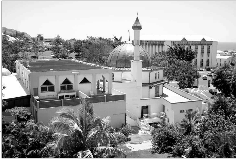
مسجد سان بولي في فرنسا