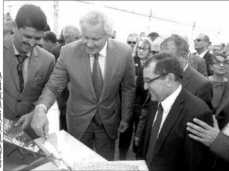
صورة عملية وضع حجر الأساس لإنجاز مصنع التوربينات باتنة

أوضح والي أن أشغال إنجاز العديد من المشاريع التنموية بالمنطقة جارية، وأن 05 مناطق نشاطات كانت قد انطلقت بها الدراسة مسجلة ضمن البرنامج التكميلي، مؤكدا أن الأولوية ستخصص لمعالجة المشاكل التي تحول دون تطوير النشاط الاقتصادي بالولاية لدعم التنمية واستقطاب مستثمرين، كما أشار إلى أهمية هذه المناطق، وربط إمكانية إنشائها بمدى توفير البلديات للأوعية العقارية التي تسمح بإنشاء منطقة نشاطات صناعية، وفي هذا السياق، ركز على أهمية البرنامج المسطر لإنشاء منطقة للنشاطات في كل بلدية بالنظر إلى عائداتها الاقتصادية بالنسبة لدعم البلديات خصوصا منها العاجزة ماليا. وأعلن المسؤول أن اللجنة الولائية لترقية الاستثمار وافقت على 180 مشروعا استثماريا، مجددا أن تحقيق التنمية بالولاية يتطلب دفع الحركة الاقتصادية على جميع المستويات ومنها الصناعية، وأن المناطق الصناعية التي يتم السعي لإنشائها في البلديات ستكون مكيفة حسب طبيعة كل منطقة، مشيرا لأهميتها الاقتصادية في فتح مناصب شغل لفائدة شباب البلديات، خصوصا الجامعيين الذين خصهم بأولوية لتجسيد مشاريعهم استثمارية.