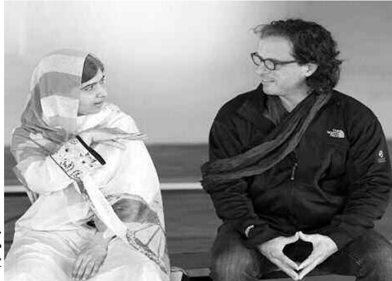
ملالا يوسف زى

ويسلط فيلم المخرج ديفيس جوجنهاليم، الضوء على حياة الفتاة ملالا، بدءاً من العلاقة الوثيقة التي تربطها بوالدها الذي زرع في قلبها حب العلم، ومروراً بتفاصيل حياتها اليومية مع والديها وأخوتها، وانتهاءً بالكلمة المهمة التي ألقاها في اجتماع الأمم المتحدة. وكانت شركة "فوكس سيرتشر" بكتشرز" قد تولت إطلاق الفيلم بالتعاون مع "إيج نيشن" أبوظبي، وبارتيسيبانت ميديا، وقناة "تاشيونال جيوغرافيك". وقد عمل على إنتاج الفيلم الوثائقي والتر باركرس ولوري ماكندالز، ضمن شراكتهما الطويلة مع "إيج نيشن"، كما شارك في الإنتاج أيضاً مخرج الفيلم ديفيس جوجنهاليم. وفي تصريح له قال مايكل غارلين، الرئيس التنفيذي في إيج نيشن: "أفد حاز الفيلم على قدر كبير من الإعجاب والتقدير خلال العروض العالمية التي أقيمت في مهرجاني تيلورايد وتورنتو السينمائيين. نحن فخورون بمشاركنا في تقديم هذه القصة المؤثرة والمذهلة وعرضها أمام جمهور المشاهدين حول العالم، كما نشعر بالحماس بانتظار ردود الأفعال تجاهه في منطقة الشرق الأوسط".