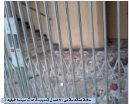
حالة متقدمة من الإهمال تصيب قاعات سينما البلدية