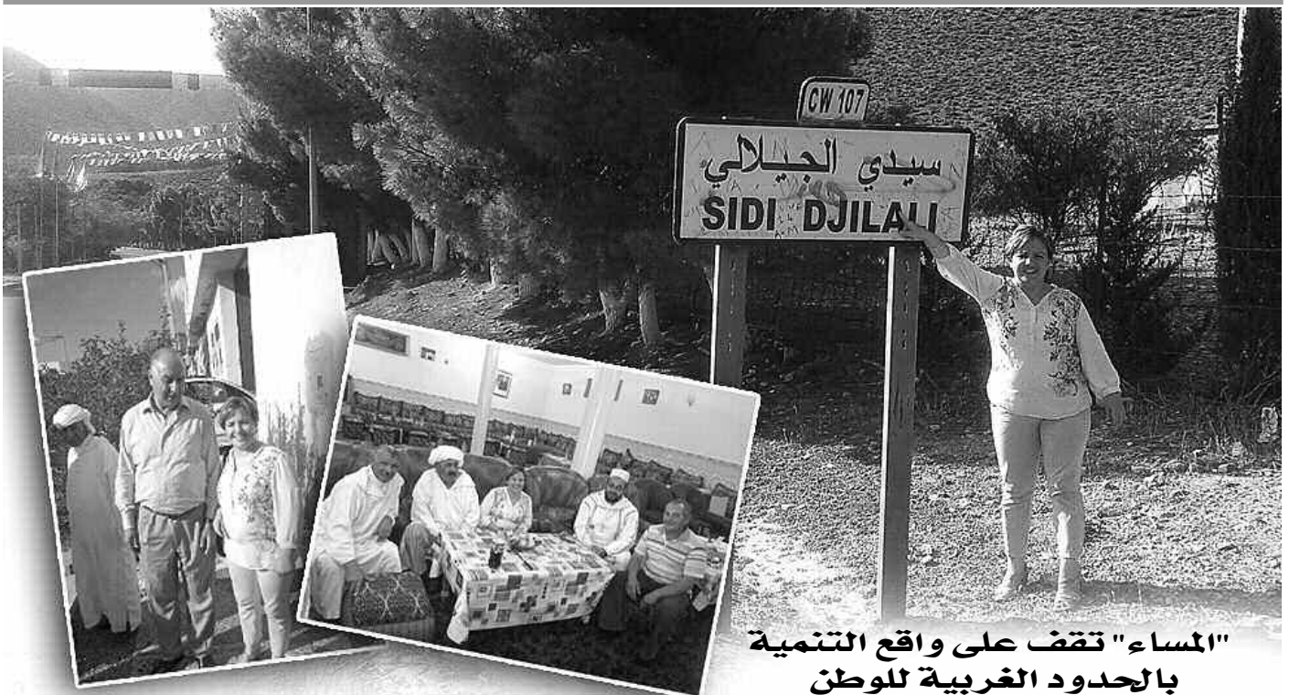
"المساء" تقف على واقع التنمية بالحدود الغربية للوطن