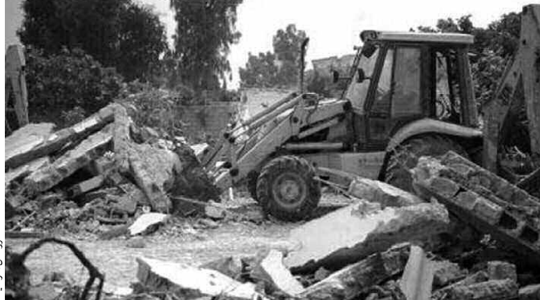
صورة من الأرض

تم استرجاع، بعد القضاء على الأحياء القصديرية ومواقع الشاليهات سابقا، أزيد من 108 هكتارات من الأحياء المقارفة في ولاية الجزائر خلال سنة 2014، خصصت لإنجاز 61 مشروعا عموميا، فيما تم تخصيص 75 هكتارا من إجمالي المساحة المسترجعة لقطاع السكن لإنشاء 7.100 وحدة سكنية في إطار برامج سكنية عمومية مختلفة.