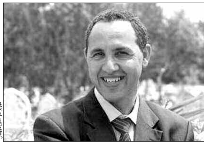
الوزير ميهوبي عن الدين ميهوبي

أعلنت مؤسسة عبد العزيز سعود البابطين الثقافية مؤخراً، عن أسماء المتحدثين من عرب وأجانب في محاور دورتها الخامسة عشرة التي تعتمز إقامتها يوم الرابع والعشرين من أكتوبر الجاري في جامعة أكسفورد ببريطانيا، تحت عنوان، "عالمنا واحد والتحديات أمامنا مشتركة". (الوكالات)