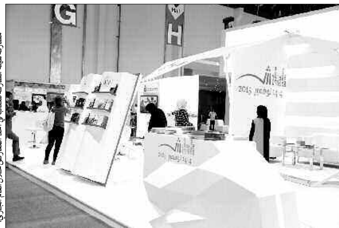
مشاركة هيئة الشارقة للكتاب في أحد المعارض خلال المعرض العالمي الجاري.

سعيًا منها لتعريف الناشرين والمهتمين بصناعة الكتاب في المعارض والمؤتمرات والمبادرات التي تنظمها الشارقة في هذا المجال، تشارك هيئة الشارقة للكتاب في الدورة السابعة والستين من معرض فرانكفورت الدولي للكتاب، التي تقام في ألمانيا خلال الفترة الممتدة من 14 إلى 18 من أكتوبر الجاري.