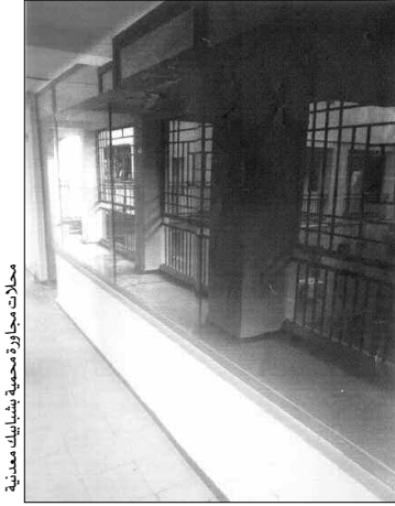
محلات مجاورة محمية بشبكات معنوية