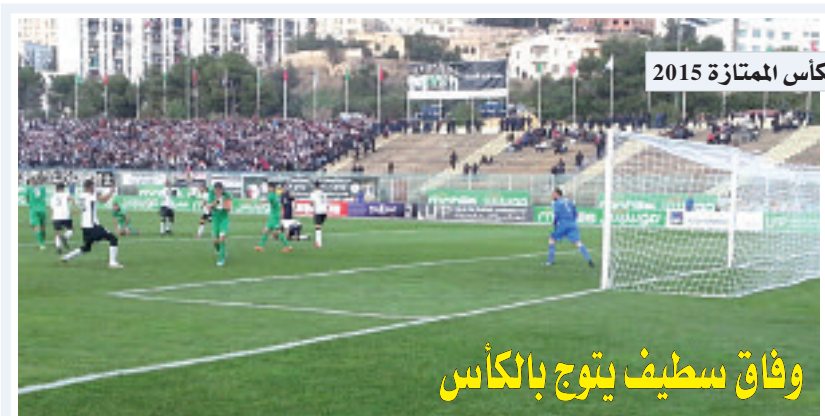
الكأس الممتازة 2015