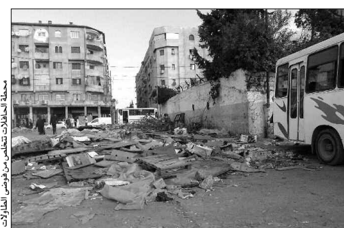
مشروع السوق الجوارية... وتحويل نشاطات المتسوقين