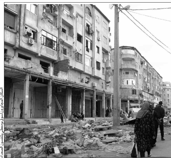
السكان المجاورون لسوق بومعطي يتشكون المصاد

عندما زرنا مكان سوق بومعطي بالحراش صباحا، وجدنا بعض الجرافات والشاحنات تستكمل تجريف ونقل الردم وبقايا اللعب الكرتونية والبلاستيكية والنفايات المعدنية، ويبدو لكل من يمر بهذه البقعة التجارية التي عمرت لسنوات طويلة، كأن زلزالا قويا دك المكان دكا، فجعله في "خبركان"، كما يقال. ولأحطنا بعض التجار الفوضويين في حيرة من أمرهم، حيث تجمع بعضهم وراحوا يتحدثون بلهجة اختلطت فيها عبارات السخط والانتقاد إزاء هذه العملية التي قضت على رزقهم - كما قال أحدهم - وأوقفت نشاطهم في رمشة عين، أما التجار فكان البعض ممن فتحوا محلاتهم تظهر على أوجههم علامة التأسف، كونهم لم يجدوا زبائنهم المعتادين الذين كانوا يقبلون بكثرة على محلاتهم، وفي هذا الصدد، ذكر لنا بعضهم أن تجارتهم