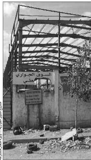
مشروع السوق الجوارية... وتحويل نشاطات المتسوقين

طويلة، حتى ذاع صيته في عدة ولايات أخرى، وصار مكانا للتلذذ بالجملة والتجزئة، وذكر لنا أحد تجار الجملة، مختص في بيع مواد