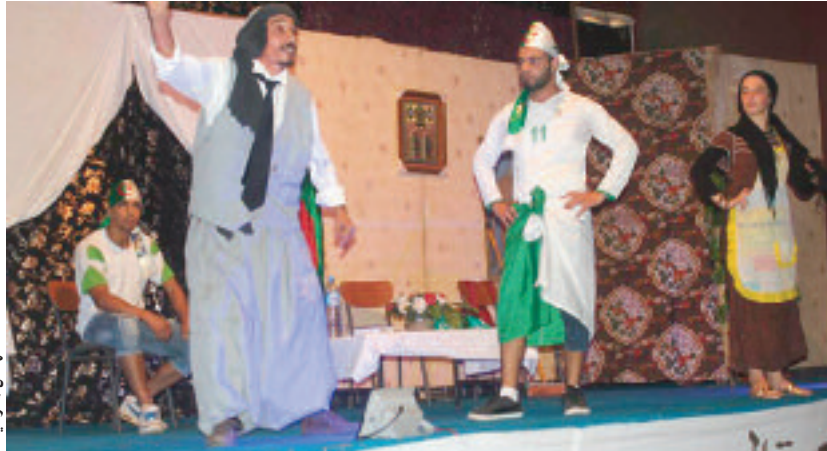
مشهد من المسرحية