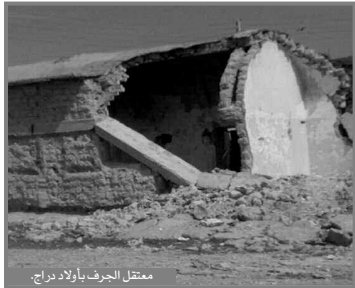
معتقل الجرف بالأردن

الجرف شرق مدينة المسيلة، على بعد 17 كلم، أي ببليدة أولاد دراج ويضم 18 بناية أثرية، كل واحدة بها 4 مسكن مكونة من 5 غرف.