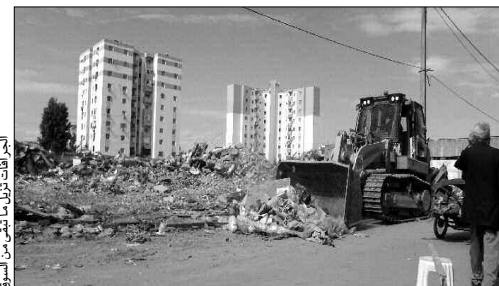
الجرافات تزيل ما تبقى من السوق