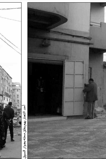
أحد التجار يهبط بطنه بجوار السوق