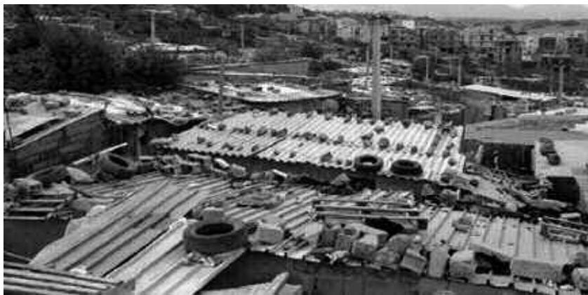
التي كانت تشغلها.

وجه التنمية، وتتسبب في الكثير من الأحيان في إخفاق المجالس الشعبية المنتخبة في تجسيد برامج التنمية المختلفة وأنداد غالبيتها، لعدم التوصل إلى الحلول الكفيلة بتحرير معضلة العقار. وسبق لوالي العاصمة في هذا الإطار، أن أوضح في ندواته وخرجاته الميدانية، أن نقص المقار بعد مشاكل كبيرة وتحديا حقيقيا يواجه السلطات المحلية (رؤساء المجالس المنتخبة)، مؤكدا على مواصلة تطوير كل بلديات العاصمة من ظاهرة البيوت القصديرية والهشة، لاستعادة المساحات التي تحتلها بشكل غير قانوني.