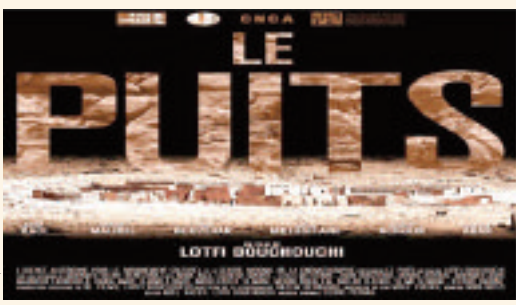
فيلم "Les Piluts"

القربي نور الدين الصايل، في حين سترأس لجنة تحكيم الأفلام الوثائقية الايطالو-أرجنتيني دانييل ألكنتيرا، كما تتميز هذه الدورة بمنح جائزة "فيبريسكي" (الجائزة الدولية للثقافة للمسرح) التي توج بها في 2013 فيلم "عطور الجزائر" للمخرج الجزائري رشيد بلحاج، فحصل على جائزة الاتحاد العام التونسي للشغل التي تمنح لأفضل تقني ومن الممتظر أن تشهد هذه الدورة حضور زهاء 350 ضيفاً من إفريقيا وآسيا وأوروبا. وستكون هذه الدورة عدداً من الشخصيات الثقافية التي رحلت منها الجريدة والرواية الجزائرية آسيا جبار، والمخرج البرتغالي مانويل دي أليفييرا بالإضافة إلى الفنانين المصريين فانت حمامة ومريم فخر الدين.