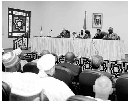
ديفوار وغينيا إليها، كانت قد تأسست بالجزائر العاصمة في جانفي 2013، علما أن الرابطة التي تضم كبار أئمة

أجمع المشاركون في الورشة الثالثة لرابطة علماء وأئمة ودعاة دول الساحل أمس على الدور الكبير والمحوري الذي تقوم به الجزائر في علاج ظاهرة التطرف الديني والتطرف العنيف. ودعا المشاركون إلى اتخاذ مشروع ميثاق السلم والمصالحة الوطنية نموذجاً يقتدى به في ربوع القارة الإفريقية لإحلال السلام.