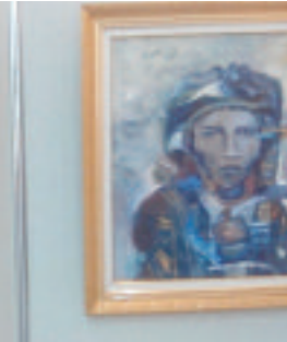
الفنان طيب بن زاوي.