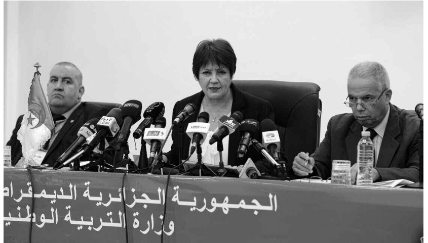
الجمهورية الجزائرية الديمقراطية الشعبية - وزارة التربية الوطنية