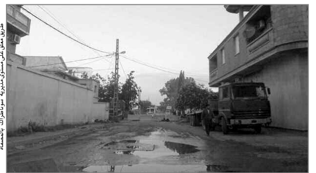
طريق مغلق على مستوى مديرية سوناطراك بالمشقة

مشكلهم الذي تقاوم - حسبهم - بسبب غلق الطريق المذكور الذي تم اقتطاعه من أراضيهم الخصبة التي تترعب على مساحة تزيد من ستة هكتارات، هذه الأخيرة أصبحت مهددة منذ سنوات بالخصاف، جراء تسرب مادة البترول الخام إلى المتبقي المائي المستعمل في سقي مزرعتهم، وأنهم رغم الشكاوى المتكررة للمصالح الفلاحية، لحل المشكل، إلا أنها لم تحرك ساكنا، كما يطالب ورثة منصور والي العاصمة، بقبول مقترحهم لفتح ممرهم من أراضيهم لصالح الولاية كي تتجزأ طريقا بعيدا عن المصفاة، ومنه حل المشكل نهائيا، على أن تعوضهم بأراض أخرى بنفس المساحة.