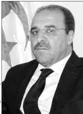
السيد محمد بوشمة

يعمل رؤساء البلديات ومسؤولو المصالح الفلاحية في الولاية، على تسوية مشاكل الأراضي العالقة، خاصة في مجال توثيق الأراضي، حسبما أكده والي الولاية، السيد محمد بوشمة.