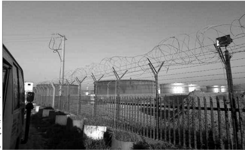
محيط المصفاة بالقرب من حي المناصيرية

تفاجأ سكان حي المناصيرية الذي يقع الجزء الأكبر منه ببلدية براقى والأخر ببلدية الكايتوس، بقرار غلق المسلك المذكور الذي وصفوه بـ"الصاعقة"، بالنظر إلى عدة أسباب، على رأسها كساد النشاط التجاري، إذ أجبر أكثر من 12 تاجرا على إغلاق محلاتهم وتوقيف تجارتهم. مثلما لاحظنا في زيارتنا للحي.. وفي هذا الصدد، اشكت البقية القليلة من التجار من هذه الوضعية التي أتت على مصدر رزقهم في رمشة عين، مصرحين لنا بأنه كان من المفترض أن تقوم مصالح ولاية الجزائر بإشعار السكان بهذا القرار لأخذ احتياطاتهم اللازمة، وأن ذلك كان دون سابق إنذار، مطالبين بتعويضهم عن خسائهم المعتبرة.