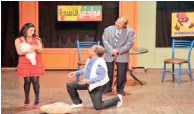
مشهد من مسرحية "الهائشة" ١٠٢

بالمدينة من تغيرات. ومن اشتداد العنف يُكتشف أن «البيئة» ما هي إلا إنسان قد حولته الغزوة إلى حيوان لا يعترف بالحق، بل بالصدافة والوفاة، كما تسلط المهرجية الضوء على شخصية البشير، وهو موظف بسيط لم يبق بدسات عليا تولاه لم يكن مرموقا في المجتمع، فقام بزل نفسه في الناس، خاصة أمام ترعيع الحق في المعيشة، فلم يجد طريقا لتجديد طابع الناس كالنفاق والكذب، والتي جردتهم من الصفات الإنسانية كالإخلاص، الخصال الطيبة والصدق، ووجد متفسه الوحيد في شرب الخمر لتخفيف من الألم عزلة. وتخلّى صديق بنجر عنه وحتى بكائه سارت في نفس الشجر، أبعد من ذلك فقد تحولوا تدريجيا إلى كانتات حيوانية، حيث قضت هذه الظاهرة وانتشرت بصورة سريعة إلى درجة أصبحت «الصفات الحيوانية» أمرا طبيعيا، بل وجد البعض أنها تدخل في الأسس التطور والرقى.