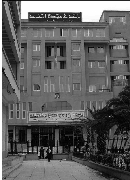
بالبلدية عقب اللقاء الذي جمع المتخاصمين بالوالي المنتدب، جددت