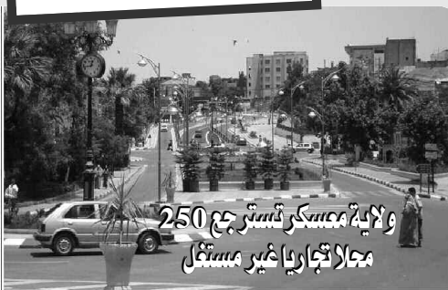
ولاية معسكر تسترجع 250 مجالا تجاريا غير مستغل

ينظم تجمع أمل الجزائر «تاج» غدا احتفالية مزدوجة بفسندق سفير مازفران بزرالدة، بمناسبة الاحتفال باليوم الوطني للصحافة المصادف 22 أكتوبر والذكرى 51 لاسترجاع السيادة الوطنية على الإذاعة والتلفزيون، المصادف 28 أكتوبر من كل عام. وسيشرف رئيس الحزب السيد عمر غول على الاحتفالية المقامة على شرف الصحافة الجزائرية، حيث سيعلن عن جائزة «تاج» للصحافة لسنة 2013.