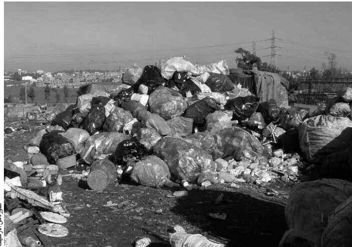
صورة من أرصفة

وتشكل أطنان النفايات المنزلية التي ترمى عشوائيا عبر 36 بلدية وفي الوديان ومساحات أخرى في فضاءات بعيدة عن التجمعات السكانية، خطرا بيئيا على صحة الإنسان، فضلا عما تشكله من تشويه للمناظر الطبيعية، وهي المشكلة التي أثارها جمعيات حماية البيئة للحد من ظاهرة انتشار المفرغات العشوائية على مستوى مدخل ومخارج البلديات. وقد أرجع مصدر من مصالح البيئة في الولاية الأمر إلى عدم كفاية المفرغات العمومية المرافقة ومراكز الردم التقني المتوفرة على إحتواء كافة البلديات، إذ لا تتوفر الولاية سوى على 03 مراكز ردم تقني منتشرة عبر بلديات باتنة، عين التوتة وبريكة بالإضافة إلى 06 مفرغات عمومية مراقبة عبر بلديات تبعث بالجهة الشرقية والمعدن شمالا ورأس العين في الشمال الغربي ومروانة غربا ونقاوس بالجنوب الغربي، وأريس جنوبا.