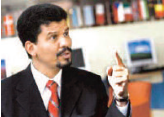
محمد يسم بيسط

اجتاحت المنطقة في أكتوبر الماضي خاصة في مجال التربة والصحة.