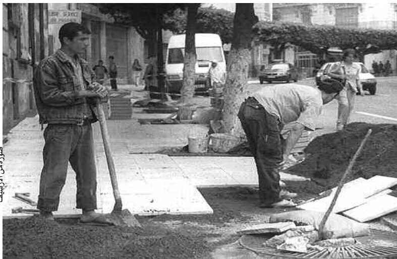
صورة من أشغال التهيئة الحضرية